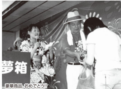
豪華商品、おめでとう!!