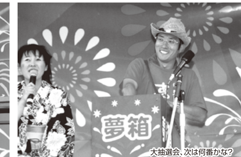
大抽選会、次は何番かな?