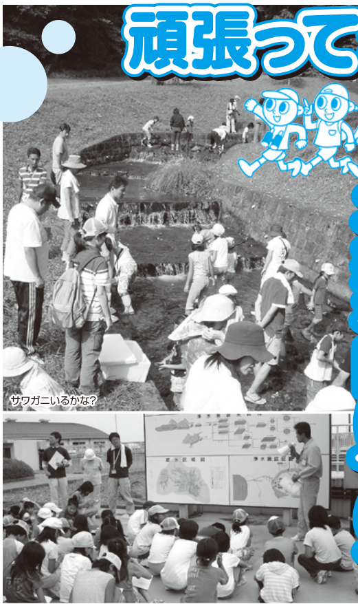
サワガニいるかな?

「皆さんは、猪苗代湖は日本一きれいな湖という事を知っていましたか?」 一年間に猪苗代湖の水の約12%(約2ト)がこの郡山市で利用され、残り88%は新潟県に流して利用されていると言事も初めて知りました。堀口浄水場も見学しました。子供達は沈砂池や薬品沈殿池などをビックリながら観察しました。お昼は高篠山森林公園で昼食を食べ、青年部スタッフの皆さんのご厚意で美味しいとん汁を頂きました。(株)