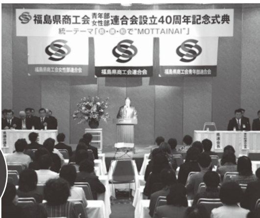
福島県商工会青年部連合会設立40周年記念式典 統一テーマ「MOTTAINAI」