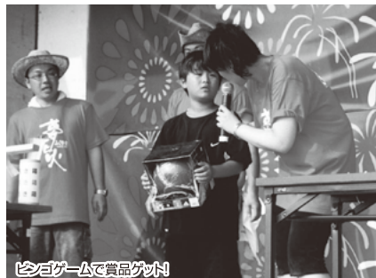
ビンゴゲームで賞品ゲット!