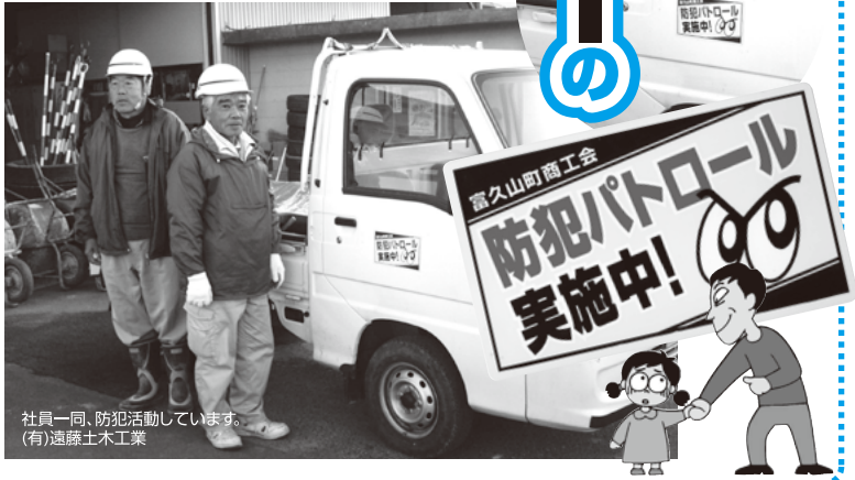
社員一同、防犯活動しています。(有)遠藤土木工業

街頭犯罪抑止対策として会員の車両に表示することで、ドライバーの防犯意識も高まり、地域住民が安心して暮らせるまちになるように犯罪の抑止に努めています。