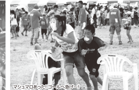
マシュマロあった! ゴールへ急げ~!