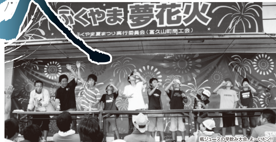
瓶ジュースの早飲み大会、よーいドン!!