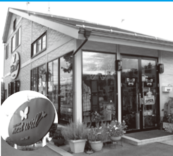
セレクトショップ next will ネクストウィル 富久山町八山田字土布池11-36 TEL.953-8803

こんにちは。オープンして1年6ヶ月になりました。当店は子供ドレスからファッション小物・レディス洋品まで、一店一品を店長がお客様の気持ちを大切に、心を込めて仕入をしております。お求めやすい価格で流行も取入れた品々をどうぞゆっくりとお買い物をお楽しみ下さい。オープン時間は午前10時30分より午後6時。休日は月4回となっています。駐車場も8台完備しております。これからも「笑顔接客」で頑張ります。