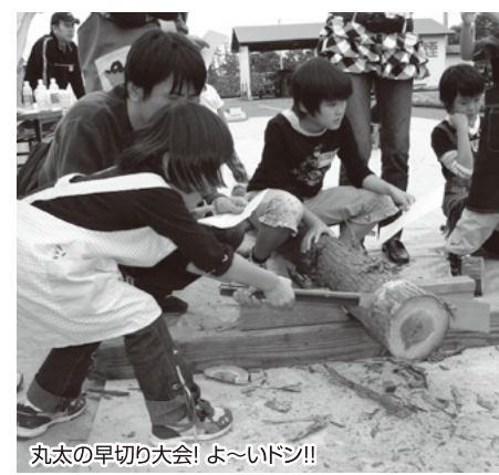
丸太の早切り大会! よ~いドン!!

3つ目は左官体験。木枠に自分できれいに珪藻土を塗り、親子の手形と飾りをつけて記念品作り。かべにきれいに塗りつける体験では仕事の難しさを学びました。