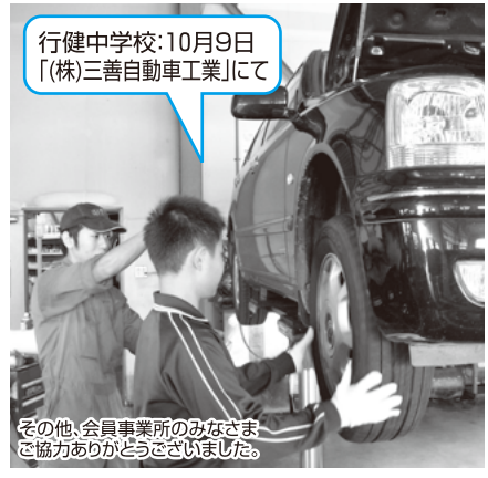
行健中学校:10月9日「(株)三善自動車工業」にて