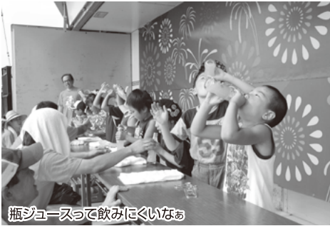
瓶ジュースで飲みにくいなあ