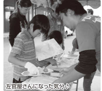
左官屋さんになった気分

市内の小学生の親子を対象にした職業体験「キッズ・チャレンジ郡山」が田村町にある県中央木材市場で開催されました。4つの班に分かれて4つの体験。