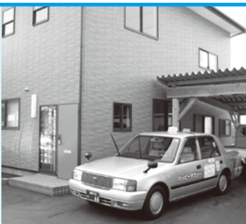
(有)ハッピータクシー 富久山町福原字中之内23-10 TEL.933-2444

いつもご乗車ありがとうございます。ハッピータクシーです。車両10台と小さな会社ですが「タクシーはわが町わが家の自家用車」をスローガンとし、安全安心な運行を心がけております。7月に移転し、富久山の皆様には見かけることも多いタクシーになってきているかと思えます。お近くでもお気軽にご利用いただきたいと思います。今後もより一層のサービス向上に努めますのでこれからもよろしくお願いいたします。