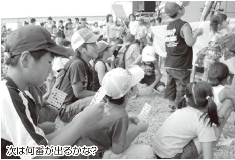
次は何番が出るかな?

今年で第17回を迎えた「夢花火」そして「子供まつり大会」を開催いたしました。今年には「クラブス郡山」のチアリーダーにオープニングを飾って頂きました。それから恒例の「マシュマロ探し大会」「ピンゴゲーム大会」、また昨年からは始まった「ジュース早飲み大会」と会場の子供達は大変盛り上がりました。 また、大抽選会では任天堂の「Wii」DSやソニーの「PSP」など豪華商品を揃えました。今年からは企業協賛枠を設け、4社から景品を協賛して頂き、さらに抽選会を盛り上げることができました。ご協力ありがとうございました。 来年も子供達の笑顔がみられる様、又、夏休みの思い出にこの「子供まつり大会」を企画していきたいと思っております。来年も待っています。絶対来てね!