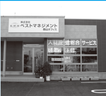
(株)ベストマネジメント 富久山町久保田字金堀田44-1 ☎0120-915-715

はじめまして、三春に本社がある、人材派遣総合サービスの「株式会社ベストマネジメント」です。今年3月に富久山町久保田字金堀田(国道4号線沿い)に郡山オフィスを新設いたしました。富久山町の皆様には大変お世話になっております。弊社は、コンプライアンス順守を第一とし、誠実をモットーに事業を展開しております。急な増員や欠員でお困りの際は、ぜひお声をおかけ下さい。また、お仕事をお探しの方々も気軽にお問合せ下さい。