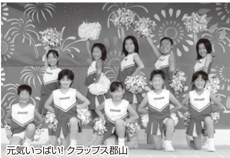
元気いっぱい! クラブス郡山