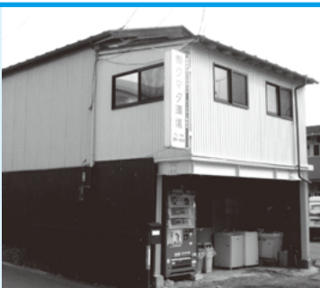
(有)クマダ環境 富久山町久保田字古町253 TEL.956-6640

いつもお世話になっております「有限会社クマダ環境」と申します。私どもの会社は建物の総合メンテナンスの会社です。内容としましては、フロアワックス・カーペットクリーニング・ハウスクリーニング・エアコンクリーニング等清掃全般です。清掃のことなら何でもお気軽にご相談下さい。住み良い環境をご提案致します。