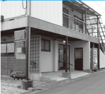
癒し処 富久山町久保田字愛宕8 TEL.933-0884

はじめまして「癒し処」です。皆さんは心身の疲労によりパフォーマンス低下させてはいないでしょうか。癒し処ではボディケア(整体)・リフレクソロジー(足裏)を手技で行い、骨格や筋肉へのアプローチだけでなく、肩こりや頭痛などの心身の緊張状態を和らげ、また免疫機能を高め自然治癒力もアップします。富久山町の癒し処となれるよう精進してまいります。皆様のご利用お待ちしております。