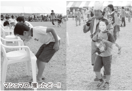
マシュマロ回、獲ったぞ〜!!